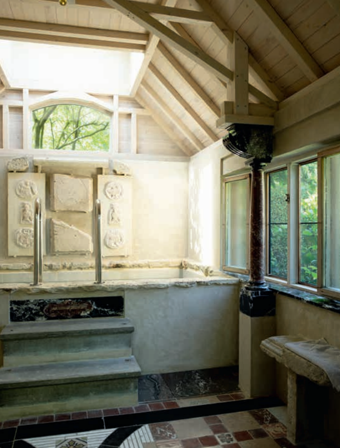
In het unieke badhuisje, gemaakt van recuperatiemateriaal, is het 's zomers heerlijk koel.