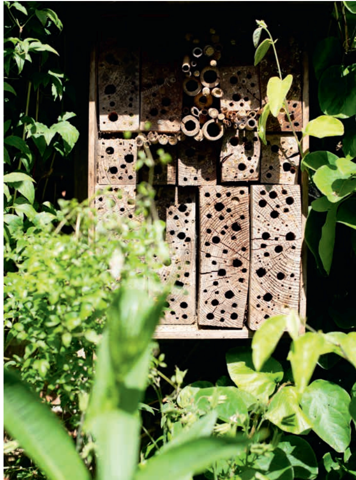
Een (zelfgemaakt) bijenhotel mag in een ecologische tuin uiteraard niet ontbreken.